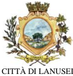
CITTÀ DI LANUSEI