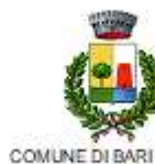
COMUNE DI BARI SARDO