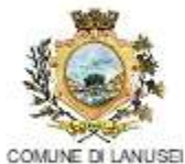
COMUNE DI LANUSEI