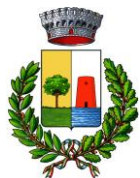
Comune di Bari Sardo