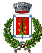
Comune di Elini