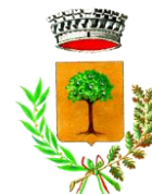
Comune di Loceri

Approvato con determina n.132 del 05/05/2026