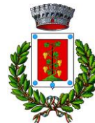
Comune di Elini