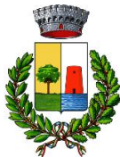
Comune di Bari Sardo