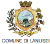
COMUNE DI LANUSEI