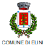
COMUNE DI ELINI