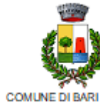
COMUNE DI BARI SARDO