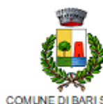
COMUNE DI BARI SARDO