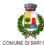
COMUNE DI BARI SARDO